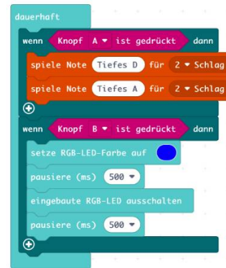
Abbildung 3: Beispiel eines Block-Programms (Projekt „Sirene und Blaulicht“)

Für den Unterrichtseinsatz gibt es schon einige Lehrbücher (unter cc-Lizenz) und Arbeitsmaterialien von deutschen Schulen und Hochschulen.