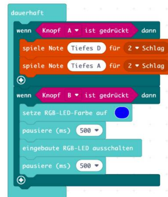
Abbildung 3: Beispiel eines Block-Programms (Projekt „Sirene und Blaulicht“)

Für den Unterrichtseinsatz gibt es schon einige Lehrbücher (unter cc-Lizenz) und Arbeitsmaterialien von deutschen Schulen und Hochschulen.